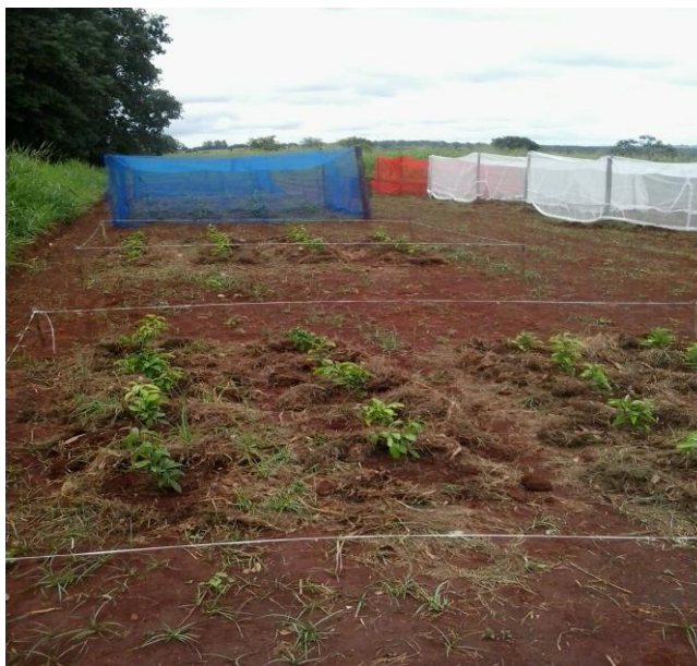
Figura 3. Parcela experimental com ora-pro-nóbis, plantado no espaçamento 1,0 x 0,5m. Fonte: Autor (2017).

Aos 80 e 120 dias após o transplântio (DAT) das mudas, foram retiradas duas plantas de cada tratamento e levadas para o Laboratório de Qualidade na Produção Sucroalcooleira da UEMG Campus Ituiutaba, para a realização das análises de produção, dentre elas o número de folhas, o número total de brotação principal e lateral, comprimento de raiz, altura de planta, massa da matéria fresca e seca do caule, folhas e raiz.