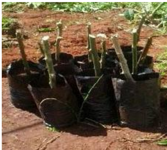
Figura 1. Estacas de ora-pro-nóbis cultivadas sob tela fotosselativa.

A partir de plantas matrizes cultivadas no município de Ituiutaba, foram obtidas as estacas de ora-pro-nóbis. A coleta do material vegetal ocorreu no mês de maio e as exsicatas dessa espécie estão depositadas no Herbarium Uberlandense (HUFU) da Universidade Federal de Uberlândia (UFU), sob o registro número HUFU 22511.