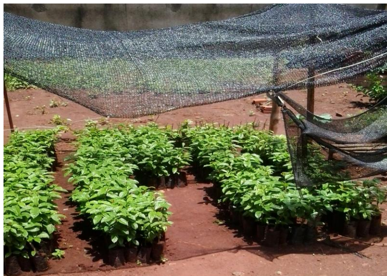
Figura 1. Mudanças de ora-pro-nóbis, com 23 dias.

O experimento foi conduzido em delineamento de blocos casualizados (DBC), com parcelas subdivididas no tempo, com quatro repetições. A parcela principal foi composta de quatro tratamentos (telas ChromatiNet® Leno Azul, ChromatiNet® Leno Pérola, ChromatiNet® Leno Vermelha, todas com 20% de sombreamento e a pleno sol) e a subparcela (tratamento secundário) constituída de duas épocas de amostragens, aos 80 e 120 dias após o transplante (DAT) das mudas. Os telados foram construídos em estruturas de madeira de 5,0 x 4,0 x 1,70 m (comprimento, largura e pé direito), com um esteio central, com altura de 2,0 m. Cada estrutura de madeira foi coberta individualmente, no teto e nas laterais, com as respectivas telas de sombreamento (Figura 2).