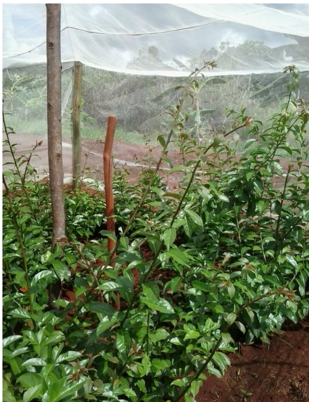
Figura 2. Estrutura de madeira com tela de sombreamento.

Cada parcela experimental foi composta por quatro linhas de 2 m, com espaçamento de 1,0 m entre linhas e 0,5 m entre plantas (BRASIL, 2010), perfazendo um total de 20 plantas por tratamento (Figura 3). A parcela útil constituiu-se por 4 plantas, sendo 2 plantas por subparcelas.